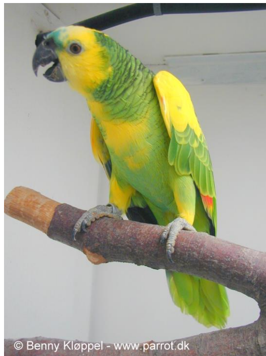
Gulvinget Blåpandet amazone